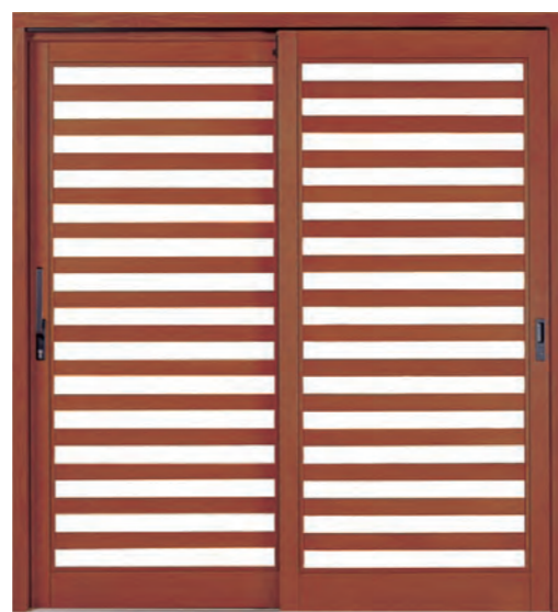
デザイン: CDタイプ 材種: ピーラー 塗装: シダー