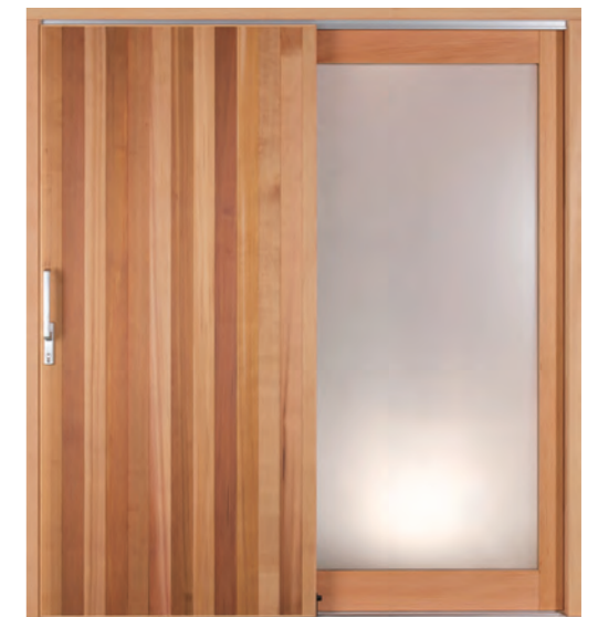
デザイン: MF-Gタイプ 材種: レッドシダー (ミックスカラー/乱貼り) 塗装: クリア