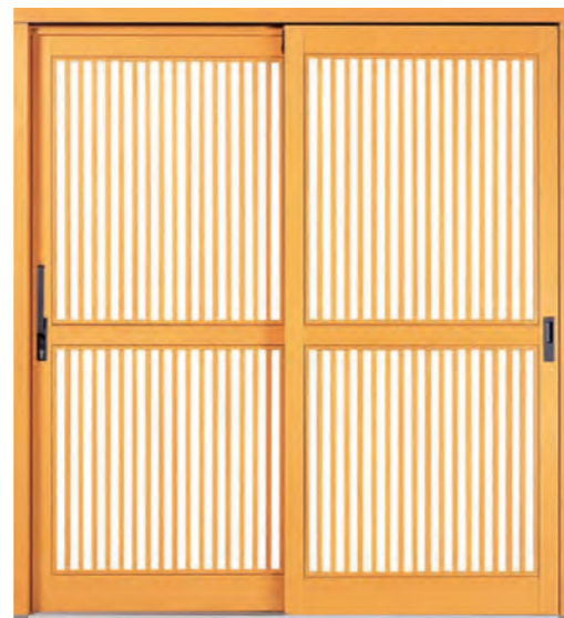
デザイン: CBタイプ 材種: 青森ヒバ 塗装: サンフラワー