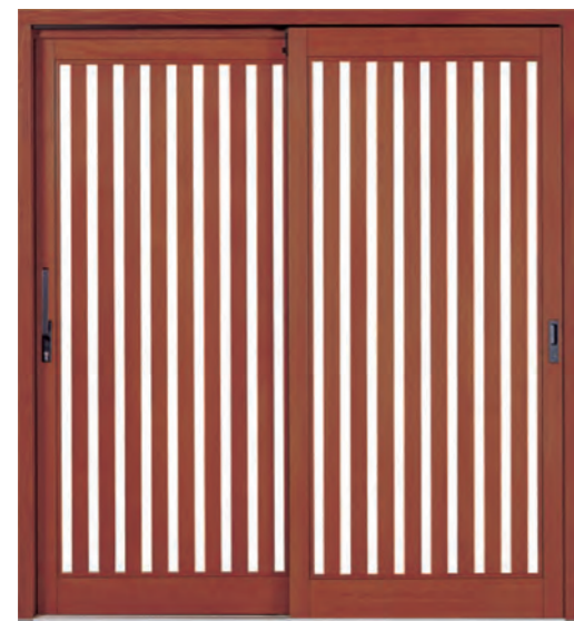
デザイン: CCタイプ 材種: ピーラー 塗装: シダー