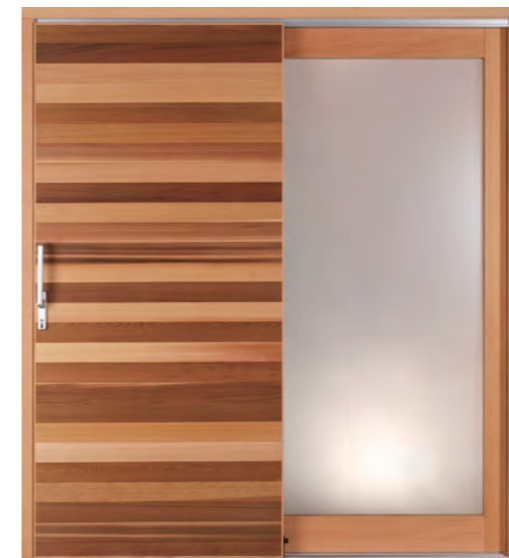
デザイン: MA-Gタイプ 材種: レッドシダー (ミックスカラー/乱貼り) 塗装: クリア