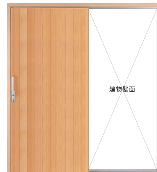
デザイン: MF-Wタイプ 材種: ピーラー 塗装: クリア