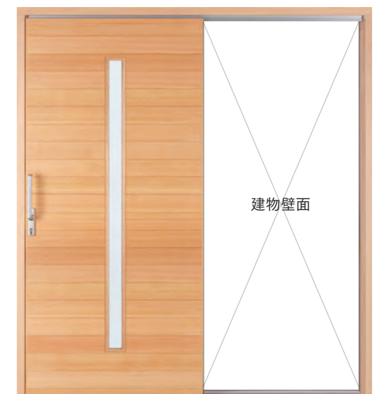
デザイン: ME-Wタイプ 材種: ピーラー 塗装: クリア