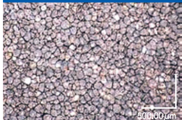
スタイロフォームFGの気泡写真