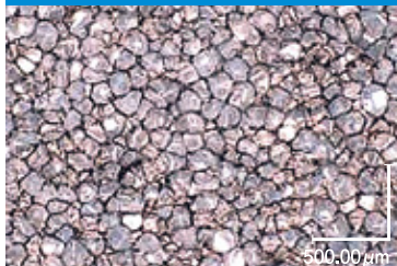
従来3種品の気泡写真